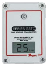
Встраиваемый в стену с ЖК-дисплеем

Высокоточный электрохимический сенсор, универсальный выход или протокол BACnet или Modbus®