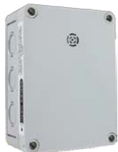
Встраиваемый в стену без дисплея