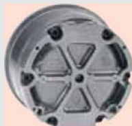
Вид сзади для монтажа на поверхности