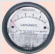
Скрытый монтаж на панели

Дифференциальные манометры Capsuhelic® могут быть смонтированы на панели или на поверхности. Для этого измерителю приложены соответствующие приспособления. На панели требуется сделать отверстие диаметром 4-13/16". Если есть проблемы с сильными ударами или вибрацией, заказывайте дополнительный монтажный кронштейн A-496 Heavy Duty (тяжелый режим). Опциональный комплект A-610 обеспечивает простое крепление измерителя на горизонтальной или вертикальной трубе размером 1¼" – 2". Установка такая же, как для измерителя Magnehelic® показана на странице 5. Все стандартные модели калибруются для вертикального монтажа. По специальному заказу измерители с диапазонами выше 5 дюймов водяного столба могут быть прокалиброваны на заводе для горизонтального и наклонного монтажа.