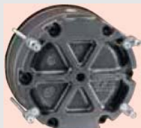
Вид сзади - показаны адаптеры для скрытого монтажа